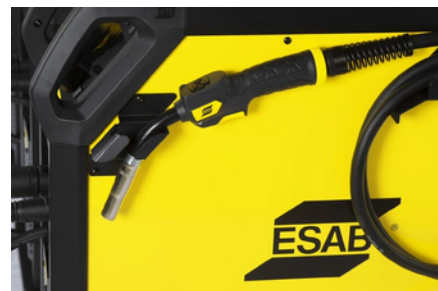
Postolje za gorionik i upravljanje kablovima