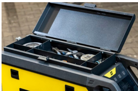
Opciona gornja kutija za alat za dodatnu opremu

Posetite ecomex.co.rs za više informacija.