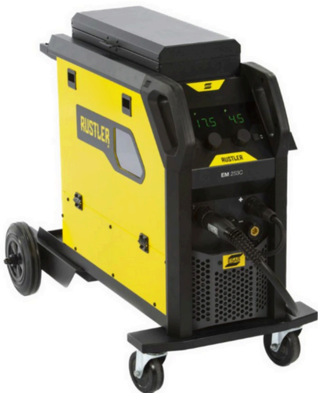
Rustler EM 253C

Rustler MIG kompaktni aparati za zavarivanje su vaše rešenje za najčešće izazove u zavarivanju.