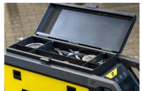
Opcioni gornji alatni odeljak za pribor