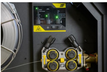
Najbolji u klasi mehanizam za uvlačenje žice

Posetite ecomex.co.rs za više informacija.