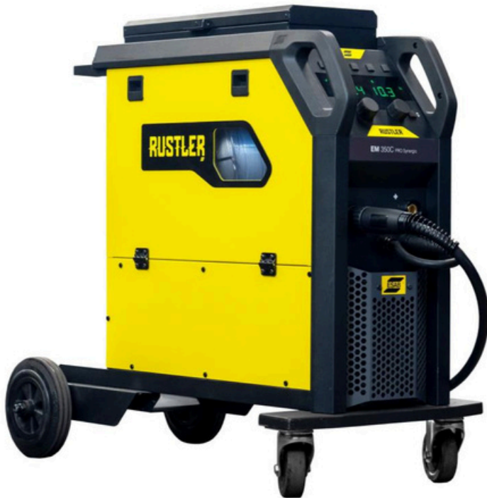
Rustler EM 350C PRO Synergic

Rustler MIG PRO compact zavarivački inverterski aparati su Vaše rešenje za najčešće izazove u zavarivanju. Opremljeni najnovijom inverterskom tehnologijom, kombinuju nisku potrošnju energije sa optimizovanim performansama zavarivanja.